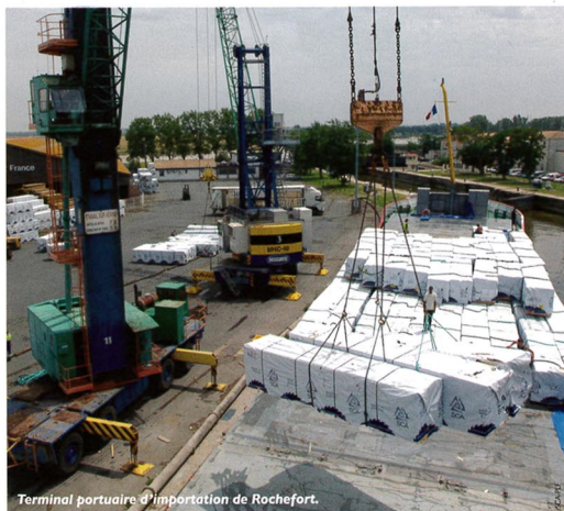
Terminal portuaire d'importation de Rochefort.