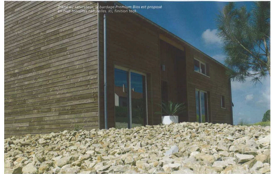
Travaux au saturateur. Le bardage Premium Bios est proposé en huit tonalités naturelles. Ici, finition teck.